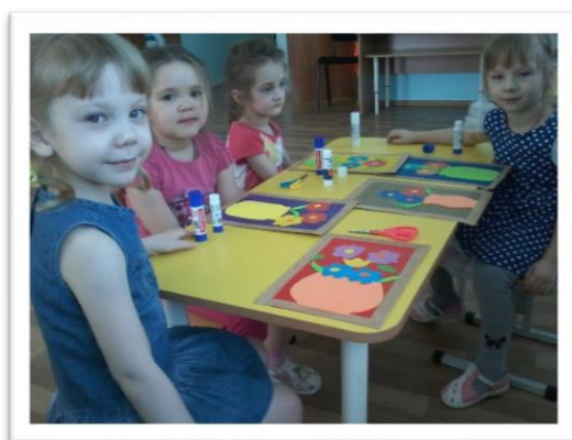
Подарок для великой княгини Елизаветы Федоровны.

Развивающие вопросы, которые можно задавать в разное время детям: как ты думаешь, далеко ли от нас страна, в которой родилась Элла? Как ты считаешь, там такая же природа, как у нас? А какая? Ты слышал, как праздновали дни рождения в семье Эллы? Какие подарки готовили дети друг другу? Какие цветы любит Элла? Люди, жившие в то время, когда Элла была маленькой, похожи на нас? Чем похожи, чем не похожи? От кого ты слышал, откуда узнал, где увидел, кто прочитал? Что тебе показалось особенно необычным, интересным? Как они чувствовали бы себя в нашей стране? Что бы их удивило?