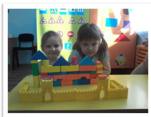
Замок маленькой принцессы.

Тема» «Святая княгиня Елизавета Фёдоровна Романова»