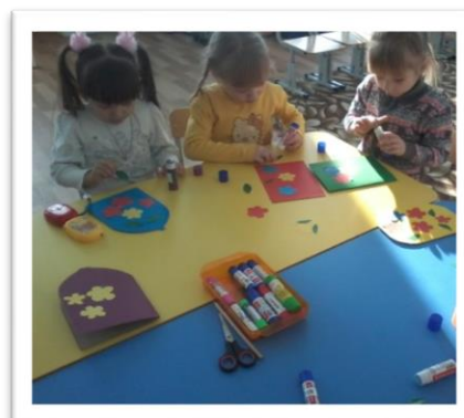
Открытка в честь памяти пресвятой.