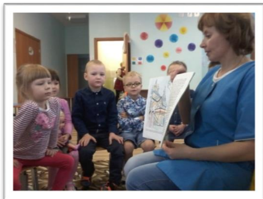
Знакомство с жизнью Великой матушки Елизаветы Фёдоровны.