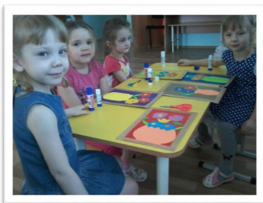
Подарок для великой княгини Елизаветы Федоровны.

Развивающие вопросы, которые можно задавать в разное время детям: как ты думаешь, далеко ли от нас страна, в которой родилась Элла? Как ты считаешь, там такая же природа, как у нас? А какая? Ты слышал, как праздновали дни рождения в семье Эллы? Какие подарки готовили дети друг другу? Какие цветы любит Элла? Люди, жившие в то время, когда Элла была маленькой, похожи на нас? Чем похожи, чем не похожи? От кого ты слышал, откуда узнал, где увидел, кто прочитал? Что тебе показалось особенно необычным, интересным? Как они чувствовали бы себя в нашей стране? Что бы их удивило?