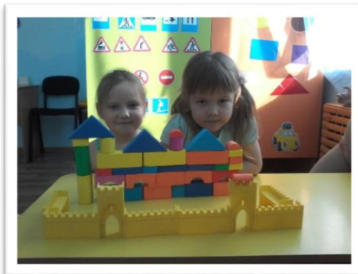
Замок маленькой принцессы.