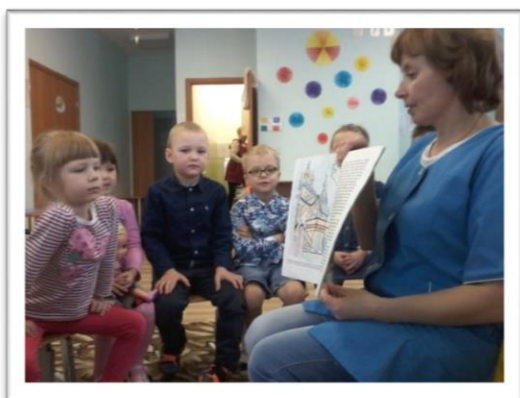
Знакомство с жизнью Великой матушки Елизаветы Фёдоровны.